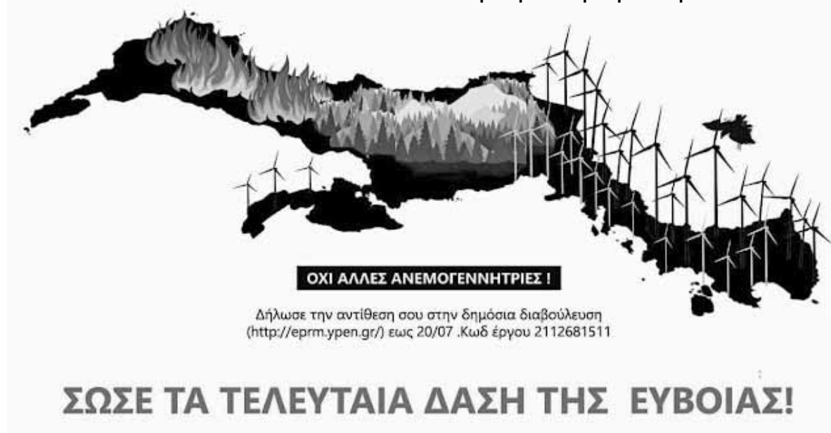
Εικόνα 2. Αφίσα για την πρόσφατη Δημόσια Διαβούλευση

Έχει παρουσιασθεί σε ημερίδες, ιστότοπους και πανάκριβες εκδηλώσεις, ένα πλάνο 10 σημείων για την ανασυγκρότηση της Β. Εύβοιας. Πράγμα περίεργο όμως: Το πλάνο αυτό ήταν ήδη έτοιμο πριν σβήσει η φωτιά του περσινού Αυγούστου. Στις 14/08/21, το ΔΙ-ΑΖΩΜΑ (σωματείο του Μπένου) έλαβε με e-mail ακριβώς αυτό το πλάνο (4), με κάθε λεπτομέρεια.