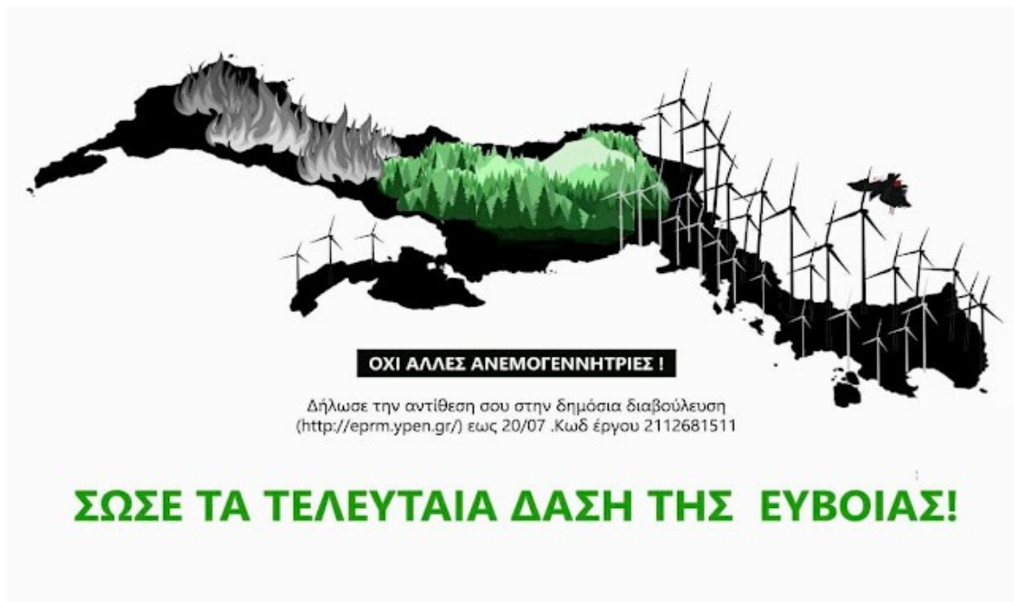
Εικόνα 2. Αφίσα για την πρόσφατη Δημόσια Διαβούλευση

Όλα τα προηγούμενα γίνονται κόντρα στις περισσότερες από 25 Ενδικοφανείς Προσφυγές εναντίον του έργου, άνω των 10 Αιτήσεων Ακυρώσεως ενώπιον των Διοικητικών Δικαστηρίων (ΣτΕ κα) και κυρίως: περιφρονώντας και ρίχνοντας στον κάλαθο των αχρήστων την Διαδικασία των Δημόσιων Διαβουλεύσεων, όπου για πρώτη φορά στην Ελλάδα υποβλήθηκαν περισσότερα των 2000 αρνητικών σχολίων, Δ11 και τεκμηριωμένων επιστημονικά απόψεων. Δείτε στην εικόνα 2 μία αφίσα που κυκλοφόρησε στο νησί και με την δύναμη της εικόνας παρουσιάζει όλη αυτή την υπόθεση.