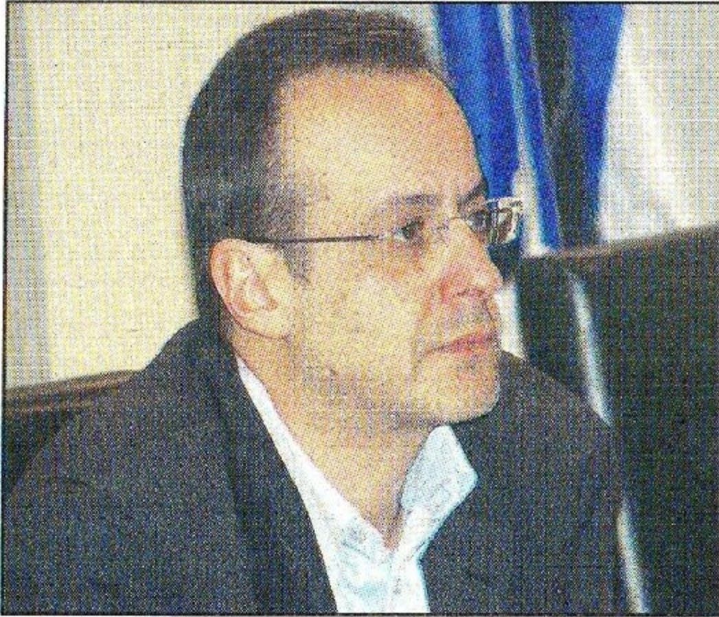
Ο δήμαρχος Θανάσης Ζεμπίλης

νέναν προσωπικά, αλλά σε όλους τους πολίτες της - αφού σε κανένα Δήμαρχο ποτέ δεν δίνεται εν λευκώ εξουσία να αποφασίζει ενάντια στην ιστορική μνήμη